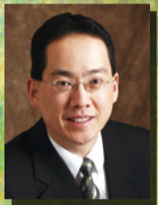
鮑維均博士 美國三一神學院新約教授及系主任