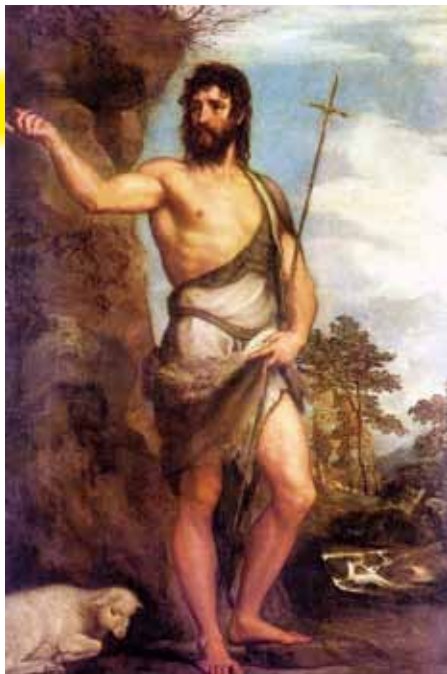
提香 (Titian, 1488-1576)：《荒野中的施洗約翰》

4 照這話，施洗者約翰在荒野出現了，宣講悔改的洗禮，使罪得赦。 5 猶太全地和全耶路撒冷的人，都出來到他那裡去，承認自己的罪，在約旦河裡受他的洗禮。 6 約翰穿駱駝毛的衣服，腰束皮帶，吃蝗蟲和野蜜。 7 他宣講說：「在我以後，那位能力比我更大的要來，我就是彎腰給他解鞋帶也不夠資格。 8 我用水給你們施洗，他卻要用聖靈給你們施洗。」