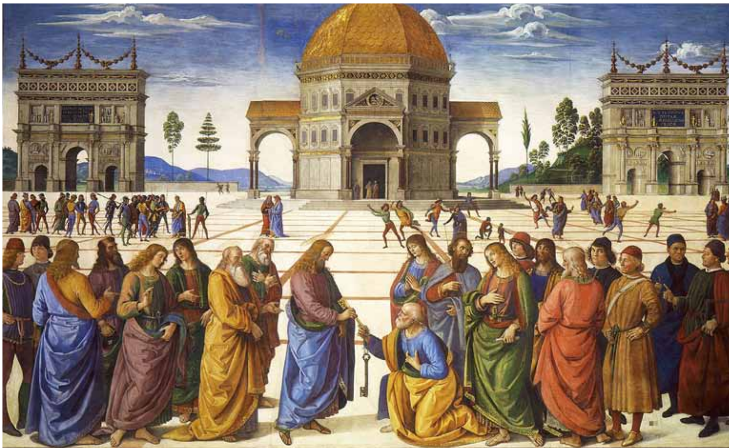
佩魯吉諾 (Pietro Perugino, 1445-1523)：《交鑰匙給彼得》