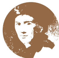
盧梭 Rousseau 法國思想家

「耶穌的一生是偉大的，是一個奇蹟；倘若誰能夠虛構這樣一個偉大的故事，除了出現比耶穌還大的奇蹟，是辦不到的。」