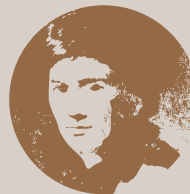
盧梭 Rousseau 法國思想家