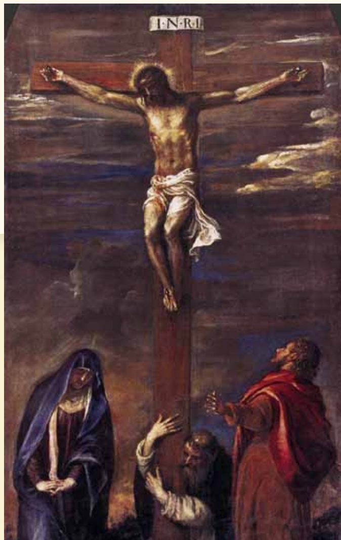
提香 (Titian, 1487-1576)：《耶穌被釘十字架》

神，你為甚麼離棄了我？」 35 站在旁邊的有幾個聽見了，就說：「看，他呼喚以利亞呢！」 36 有一個人跑過去，把海綿蘸滿了酸酒，綁在蘆葦上遞給他喝，說：「等一等，讓我們看看以利亞會不會來把他放下。」 37 耶穌大叫一聲，就斷了氣。 38 聖所裡的帳幔從上到下裂成兩半。 39 站在他對面的百夫長，看見他這樣斷了氣，就說：「這個人真是神的兒子！」 40 還有些婦女遠遠地觀看，她們之中有抹大拉的馬利亞、小雅各和約西的母親馬利亞，以及撒羅米—— 41 當耶穌還在加利利的時候，這些婦女就一直跟隨他、服侍他——此外，還有許多和他一起上耶路撒冷的婦女。