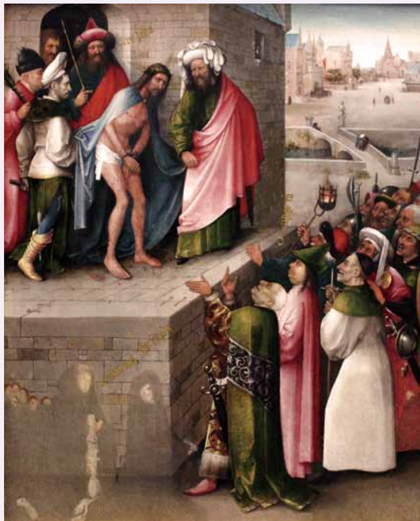
博斯 (Hieronymus Bosch, 1450-1516) : 《這人你們見過嗎》