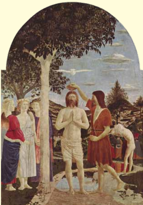
弗蘭切斯卡 (Piero della Francesca, 1416-1492)：《基督受洗》

正當施洗約翰野外的呼喊，吸引許多人注意時，在加利利的拿撒勒，又有另一人冒起，改寫了人類歷史……他的名號就是「基督」，意指「拯救者」。