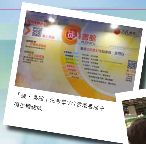
「徒·書館」在今年7月香港書展中推出體驗版